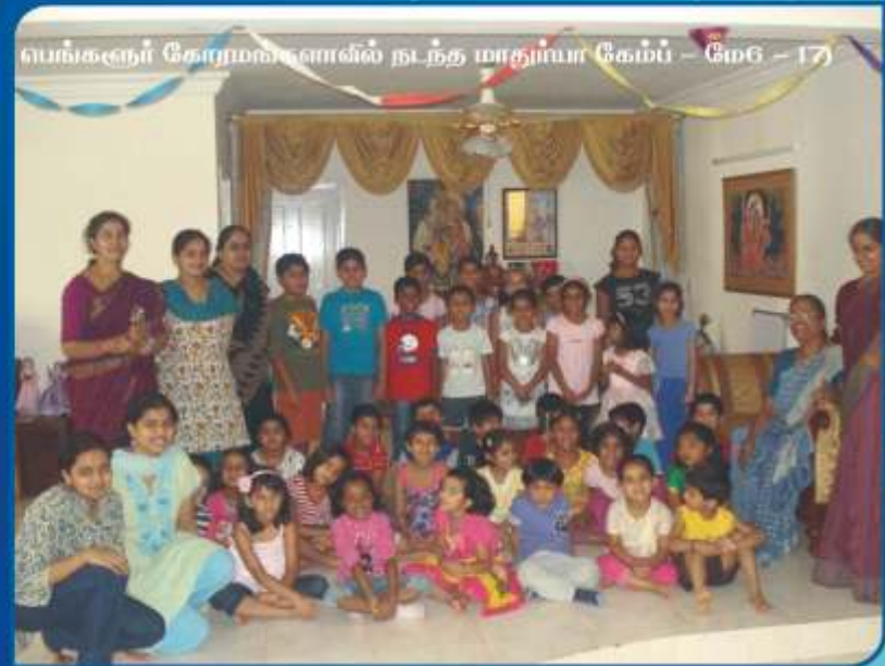
பெங்களூர் கோமுகங்களில் நடந்த மாதிரியா கேம்பு - மே 6 - 17