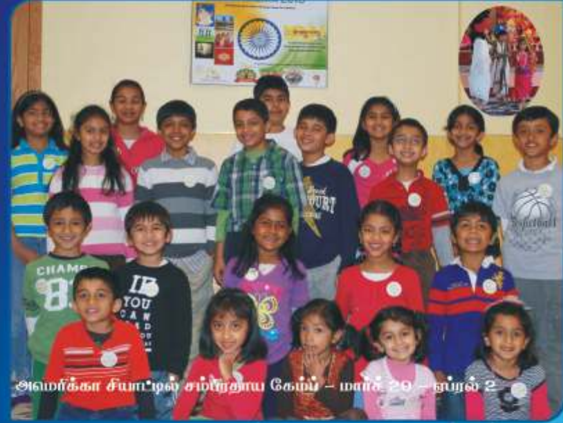
அமலக்கா சபாபிஷே சம்பிரதாய கேம்பு - மார்ச் 29 - ஐயர் 2