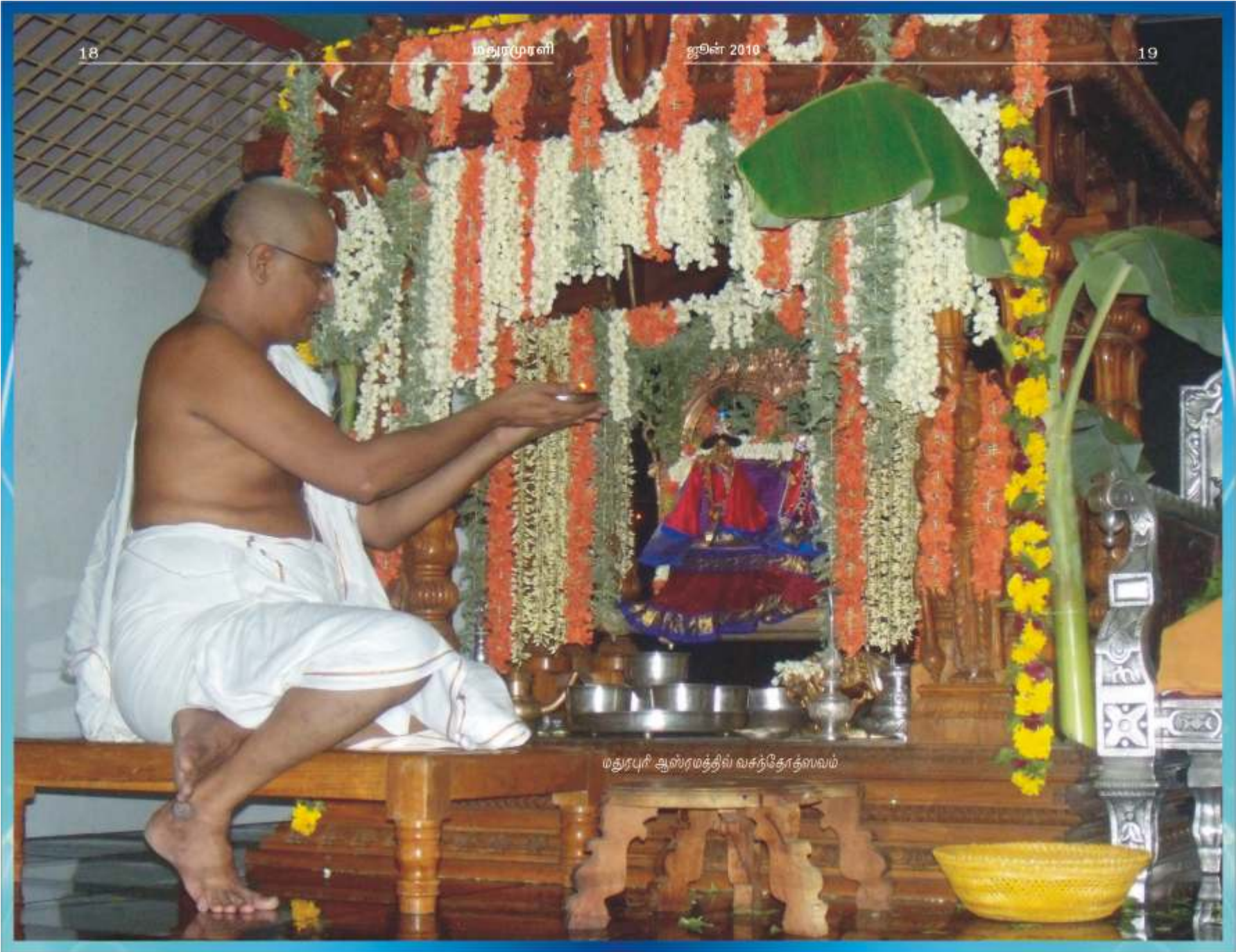
மதுராபுரி ஆஸ்ரமத்தில் வசந்தோத்ஸவம்