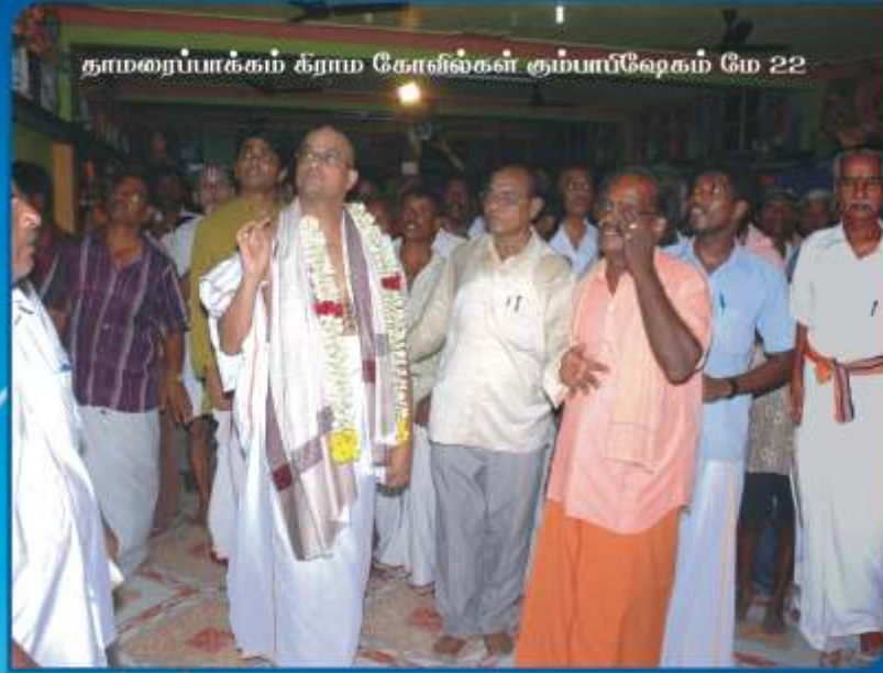
தாமரைப்பாக்கம் கிராம கோவில்கள் சும்பாபிஷேகம் மே 22