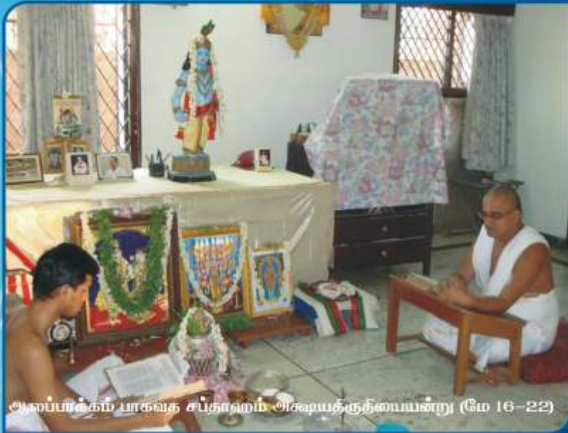
அஸ்பாக்கம் பாகவத சப்தாஹம் அக்ஷயத்தேதீயையன்று (மே 16-22)